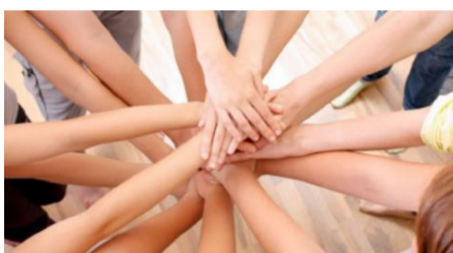
A muller e as cooperativas